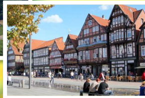
Unser Hotel „HESSE“